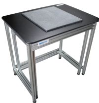
Table Anti-Vibration TAV La TAV fournit une surface solide et stable développée spécifiquement pour aider à réduire les vibrations pendant les mesures. la table permet à la balance de fonctionner avec une précision considérable malgré les courants d'air ou les mouvements qui pourraient causer des fluctuations dans les lectures.